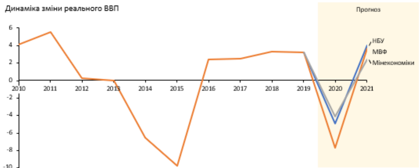
Динаміка зміни реального ВВП

Прогнозоване падіння економіки України є наслідком глобальних шоків: несприятлива ситуація на важливих для України сировинних ринках, закриття товарних ринків для українських експортерів, зміна глобальних виробничих ланцюжків. У підсумку, за прогнозами НБУ Україна у 2020 році може зіткнутися з падінням експорту (-10 відсотків), імпорту (-14,5 відсотка), розширенням дефіциту бюджету (8 відсотків ВВП) і зростанням рівня безробіття (до 9,5 відсотка).