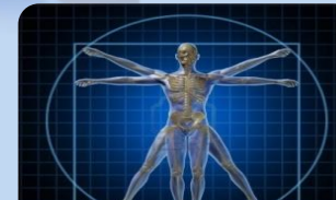
Cambios en patrón de enfermedades

INCREMENTO EN LA DEMANDA Y EN LOS COSTOS DE LOS SERVICIOS