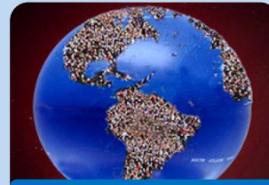
Migración y Desplazamiento