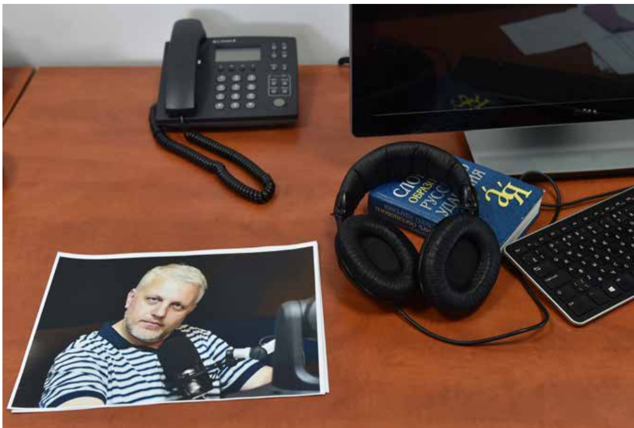
Фото Павла Шеремета на його робочому столі в офісі радіо «Вісті». Його колеги розповіли, що через досі нерозкрите вбивство репортера журналісти в Україні стали дуже обережними.

вірогідним сценарій вбивства Шеремета білоруською владою, яка таким чином помстилася йому за його роботу в минулому, оскільки він вже давно залишив білоруську політичну сцену.