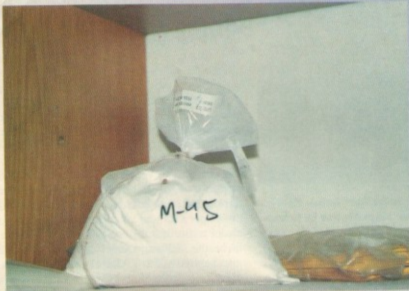
Un quilogram de clenbuterol. Al mercat negre, aquest sac val fins a tres milions de pessetes.

El clenbuterol és un fàrmac sintètic amb propietats terapèutiques per a afeccions dels bronquis. El fet que, a més, incrementi la musculatura i provoqui un guany en pes en potencia l'ús il·legal en programes d'engreix animal, segons el doctor Valverde, director de l'Institut Nacional de Toxicologia. Un vedell engreixat amb clenbuterol (que costa entre 1.000 i 3.000 pessetes el gram) augmenta ràpidament de pes menjant menys pinso. La carn que dona té més muscle, és menys greixosa, i pot ser considerada de categoria superior. A més de l'estalvi de temps i pinso, el preu de la carn augmenta.